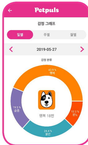
5가지 감정 인식 교감 기능